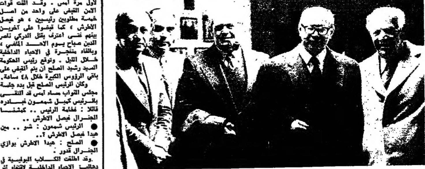
في «دار الصياد» امس، يتوهم البين: سعيد فريخ، السفير السوفياتي السيد سولدانوف، السكرتير الاول في السفارة السوفياتية، عصام فريخ، ورفيق خوري ■

«انا بخيال»... هذه العبارة ردها اكثر من مرة السفير السوفياتي في بيروت السيد الكسندر سولدانوف، خلال الزيارة التي قام بها امس «دار الصياد» حيث تناول الضيفاء على مأدبة عيد الدار سعيد فريخ.